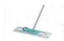
Balai à frange -lavage manuel