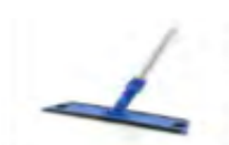
pad micro fibre- balayage humide