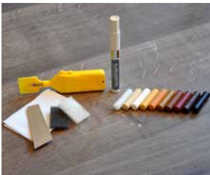
Set de réparation cire dure Réf. n° 1101060150

Pour la réparation de petits dommages dans la surface (p.e. rayures, entailles, petits trous)